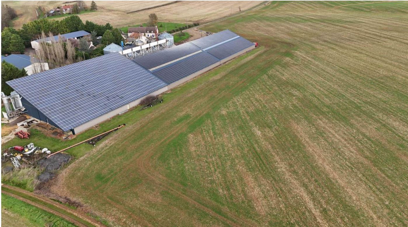
Vue B - Photographie aérienne de l’environnement lointain Prise de vue réalisée le 29/07/2024